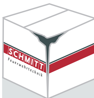
VERPACKUNG IST BESCHÄDIGT